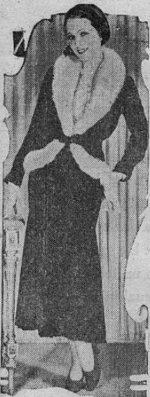
Este elegante traje de tarde está confeccionado con terciopelo verde oscuro, adornado con pieles de zorro.