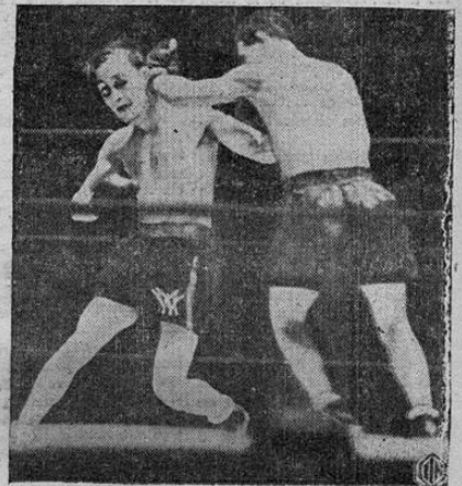
Frankie Genaro (a la izquierda) lanza una izquierda y recibe otra izquierda no menos eficaz de Midget Wolgast, el campeón mundial de peso mosca en el Madison Square Garden, de Nueva York. La pelea fué declarada empate.