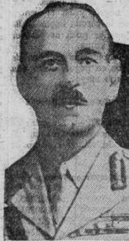
Su Excelencia el General Sir Philip Chetwode G. C. B. D. S. O., el nuevo comandante en jefe del ejército de la India. El General recibió una ovación a su llegada a Bombay recientemente, para hacerse cargo de su puesto. Fue anteriormente jefe de Estado Mayor del Ejército de la India.